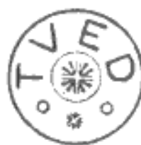
Figur 30 und 31 (Sternstempel mit Stern - Faarevejle-Type)