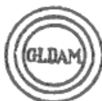
Figur 28 Esrom-Type